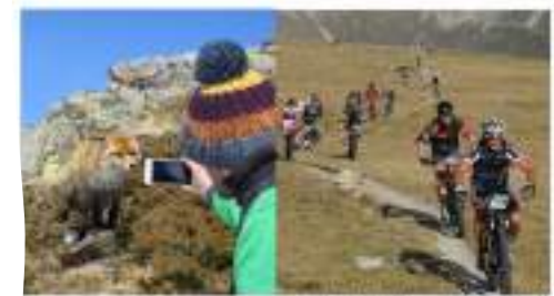
Photo: Clio Hameury et ENVO de Mouton par Rémi LAFRITTE, Technicien en charge de mission maîtrise des activités de pleine nature dans les RN catalanes Vendredi 16 mars 2024 à 16h

Biodiversité et maîtrise de la fréquentation touristique dans les réserves naturelles catalanes